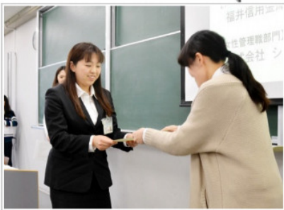
学生の視点で女性が活躍する企業と評価され、表彰を受ける企業の担当者(左)=20日、永平寺町の県立大福井キャンパス

福井県立大経済学部の飛田正之准教授のゼミ生15人が「女性が活躍できる県内企業」をテーマに、437社を調査して73社から回答を得た。このうち女性管理職がいる企業は34.2%と、厚労省の2013年度雇用基本均等調査の全国平均56%を大きく下回った。ただ女性管理職を導入している企業のうち81.4%が、登用を「大変効果あり」または「やや効果あり」と回答。収益面も女性管理職のいる企業の方が高い結果が出た。